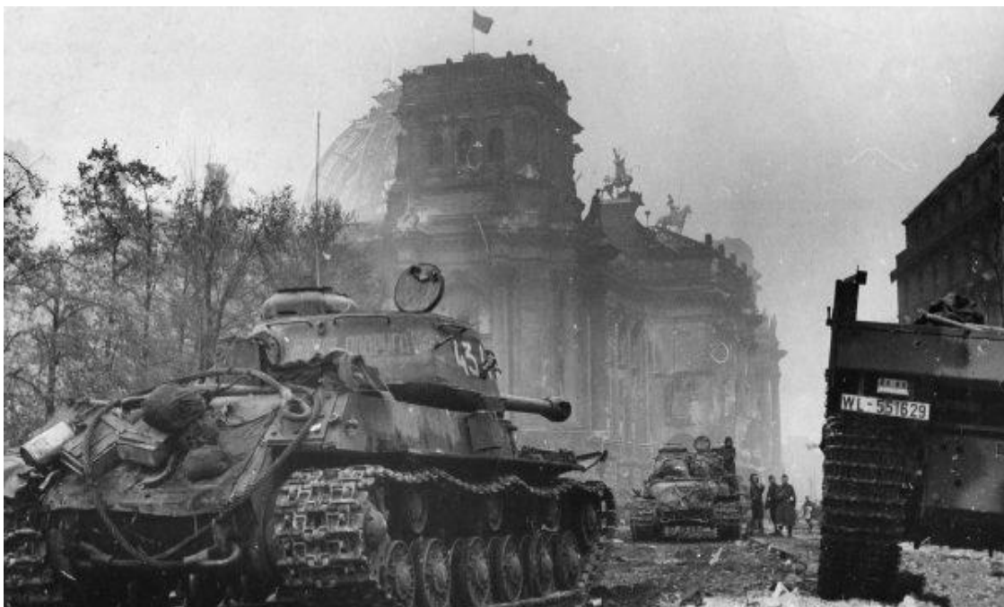
Radzieckie czołgi IS-2 w Berlinie

Radziecka ofensywa była nastawiona na unicestwienie obrońców. Dochodziło do wielu brutalnych aktów przemocy wobec ludności cywilnej. Rosjanie w ten sposób odpowiadali na okrucieństwo wojsk niemieckich podczas walk na terytorium ZSRR.