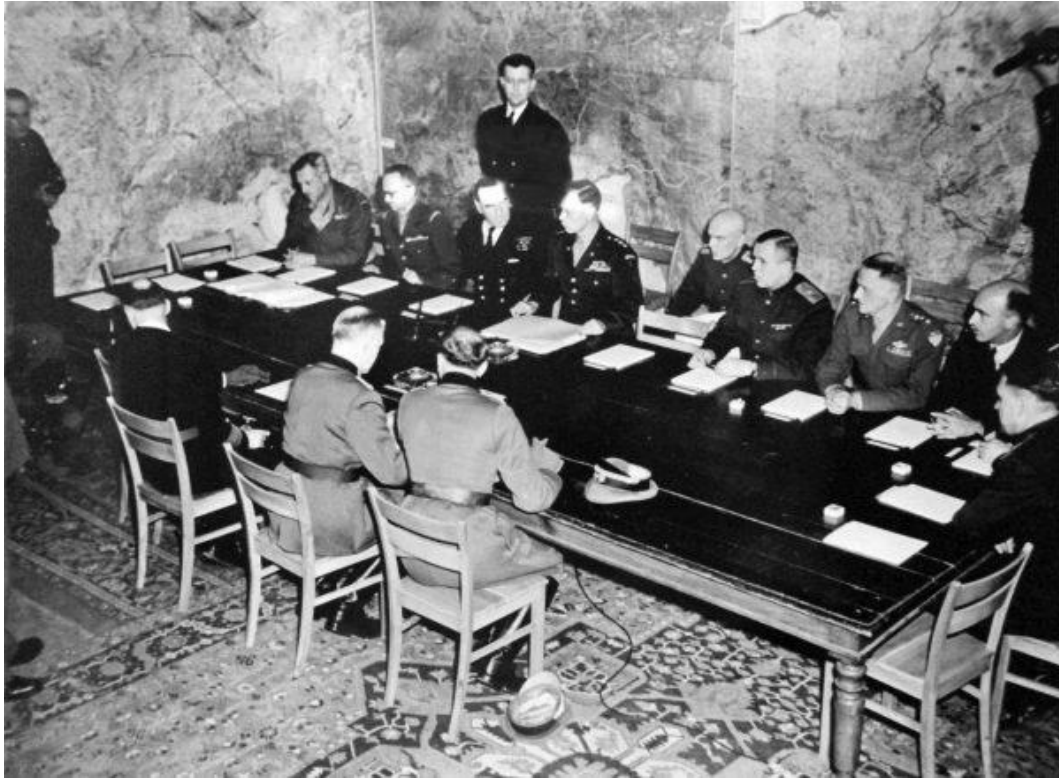
Generał Alfred Jodl podpisuje akt bezwarunkowej kapitulacji III Rzeszy

W imieniu Aliantów akt podpisał generał Walter Bedell Smith oraz generał Iwan Susłoparow. W imieniu III Rzeszy akt podpisali gen. Alfred Jodl, gen. Wilhelm Oxenius i admirał Hans-Georg von Friedeburg. Akt miał wejść w życie 8 maja o godzinie 23:01. Ze względu na naciski ze strony Józefa Stalina, 8 maja w nocy (9 maja około godziny 0:16 czasu moskiewskiego) w kwaterze generała Żukowa w Karlshorst w Berlinie podpisano drugi akt kapitulacji III Rzeszy.