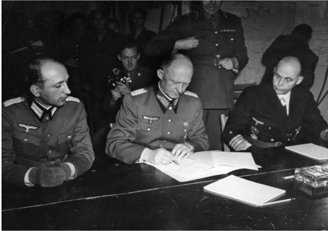
Generał Alfred Jodl podpisuje akt bezwarunkowej kapitulacji III Rzeszy

Dzień później Karl Dönitz wysłał generała Alfreda Jodla do Reims, gdzie miał negocjować warunki kapitulacji III Rzeszy. Niemcy chcieli podpisać akt kapitulacji jedynie z Aliantami zachodnimi, aby móc ewakuować swoje wojska na zachód i poddać się bardziej przewidywalnym Amerykanom i Brytyjczykom. Niemiecka propozycja została jednak odrzucona przez generała Eisenhowera, który zgodnie z postanowieniami konferencji w Casablance zażądał od Niemców bezwarunkowej kapitulacji. Generał Jodl po rozmowie z Dönitzem otrzymał pełnomocnictwo do podpisania takiego aktu.