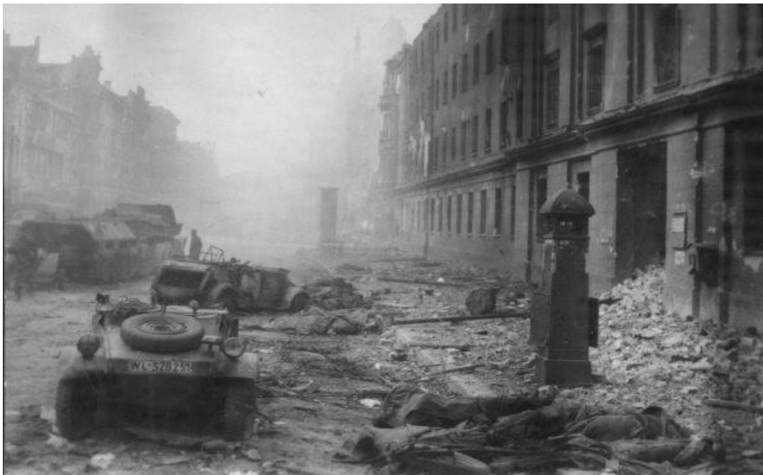
Zabici żołnierze i zniszczone pojazdy na ulicach Berlina

Jeszcze trudniejsze do oszacowania są straty materiałowe jak i informacje na temat produkcji sprzętu wojskowego. Poniższe dane mają charakter poglądowy. Straty Polski i Francji dotyczą odpowiednio okresu do końca września 1939 roku i końca czerwca 1940 roku.