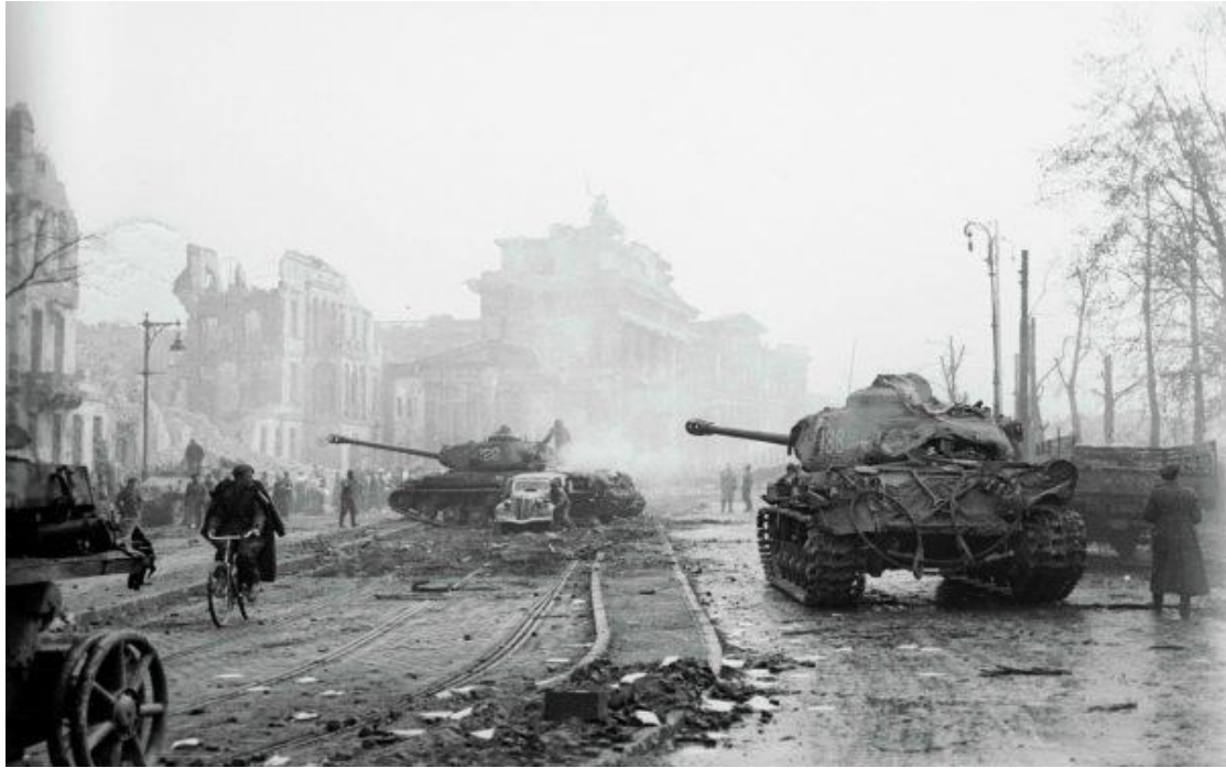
Radzieckie czołgi IS-2 w Berlinie

Przytłaczająca przewaga liczebna i materiałowa, oraz wyczerpanie zarówno niemieckiej armii jak i ludności cywilnej oraz przemysłu sprawiły, że już 21 kwietnia radziecka artyleria była w stanie ostrzeliwać całe miasto. 22 kwietnia zajęta została dzielnica Weissensee, dzień później Köpenick, a 24 kwietnia radzieckie oddziały ruszyły w kierunku centrum miasta.