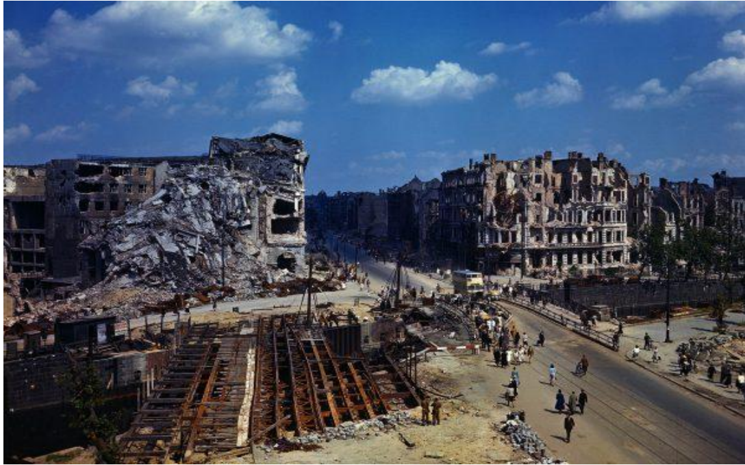
Berlin po wojnie, zdjęcie z 19 lipca 1945 roku

Ze względu na rozbieżności w sposobie określania strat, błędy i celowe manipulacje, dokładna liczba ofiar II wojny światowej nie jest możliwa do oszacowania. Przyjmuje się przybliżone wartości około 60 mln zabitych, z czego większość to ludność cywilna. Niektórzy badacze sugerują jednak, że liczba ofiar sięga około 100 mln ludzi. Śmierć poniosło około 5,4 mln Żydów, z których 3,1 mln pochodziło z Polski.