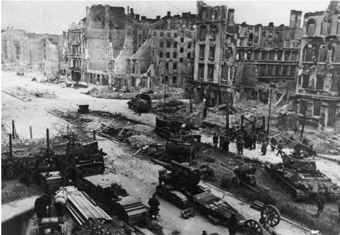
Radzieckie wojska w Berlinie

Pod tym dokumentem podpisali się w imieniu Aliantów generał Carl Spaatz, marszałek Arthur Tedder, marszałek Gieorgij Żukow i francuski generał Jean de Lattre de Tassigny. Obecność tego ostatniego miała duży wpływ na późniejszą historię, ponieważ jego podpis otworzył Francji drogę do dołączenia do państw, które utworzyły strefy okupacyjne w Niemczech. W imieniu III Rzeszy pod dokumentem podpisali się feldmarszałek Wilhelm Keitel, admirał Hans-Georg von Friedeburg i Hans-Jürgen Stumpff.