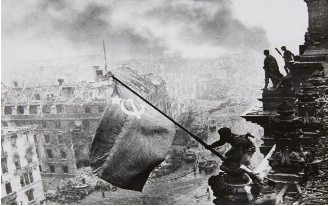
Radziecki sztandar nad Reichstgiem

Co istotne, zdjęcie Chałdieja zostało przed publikacją wyretuszowane, ponieważ na nadgarstku żołnierze zatykającego sztandar widoczne były dwa zegarki (prawdopodobnie skradzione), co nie pasowało do radzieckiej propagandy. Zegarki zostały usunięte, a do zdjęcia został dodatkowo dodany dym, aby zwiększyć jego dramatyzm. Taka fotografia została oficjalnie opublikowana 13 maja 1945 roku w czasopiśmie Ogoniok.