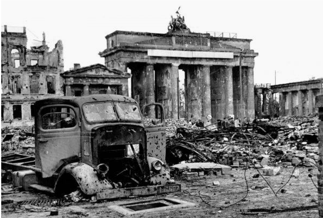
Zniszczona Brama Brandenburska

Pierścień wokół Berlina został zamknięty 25 kwietnia a 30 kwietnia radzieccy żołnierze po raz pierwszy zawiesili sztandar na budynku Reichstagu. Tego samego dnia, przywódca III Rzeszy, Adolf Hitler w swoim bunkrze w podziemiach gmachu Starej Kancelarii Rzeszy popełnił samobójstwo. Kilka dni wcześniej, 27 kwietnia we Włoszech został pojmany a następnie rozstrzelany Benito Mussolini.