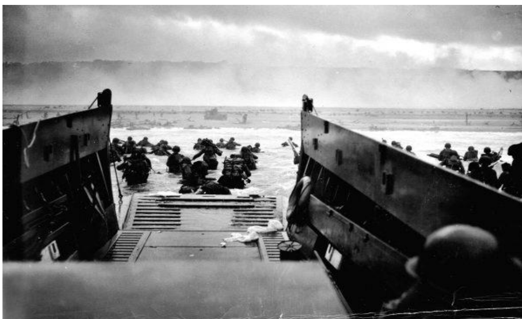
Lądowanie w Normandii

Praktycznie już od klęski pod Stalingradem w 1942 roku szala zwycięstwa przechylała się na stronę Aliantów. Kolejne niemieckie ofensywy nie przynosiły zakładanych rezultatów, a wojska sowieckie na froncie wschodnim coraz skuteczniej odzyskiwały utracone wcześniej tereny. Otwarcie kolejnych frontów we Włoszech (1943) i Francji (1944) było kolejnymi gwoździami do trumny III Rzeszy.